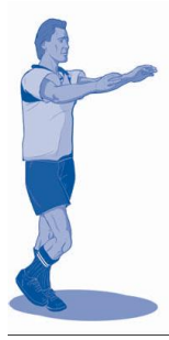
Ley de ventaja